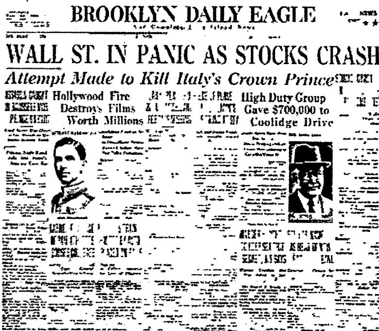
> La prima pagina del Brooklyn Daily Eagle quando negli Usa scoppiò la crisi economica del 1929